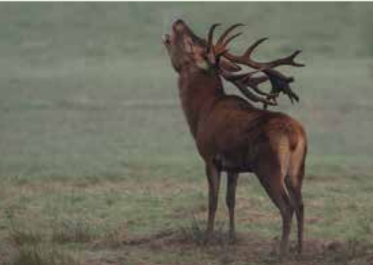
Üfter Mark • Kranenmeer • Sternbusch

Na klar – die Wildpferde im Merfelder Bruch sind berühmt, eines der Aushängeschilder unseres Naturparks! Und diese letzte Wilding-Herde auf dem europäischen Kontinent lohnt jeden Besuch, gerade auch abseits vom Publikumsspektakel des jährlichen Junghengste-Fangs. Kleiner Tipp: Besonders spannend sind die dort angebotenen fachkundigen Führungen. Aber wenn du in Dülmen losradelst und nur an Wildpferde denkst, hast du womöglich ganz in der Nähe ein heimliches, aber echtes Juwel verpasst: Den Wildpark Dülmen. Hier lassen sich in weitläufiger, wunderschöner Parklandschaft Dam- und Rotwild sowie Schafe in freier Umgebung beobachten.