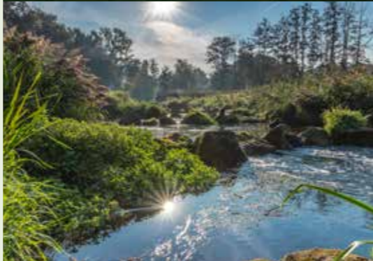
Hervester Bruch • Steverau • Dingdener Heide • Burlo-Vardingholter Venn