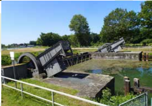
Dattelner Meer • Wesel-Datteln-Kanal • Schleuse Datteln • Alte Fahrt Olfen