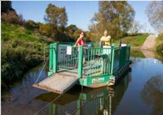
Lippefähre • Düwelsteene • Sythener Mühle • Femeiche