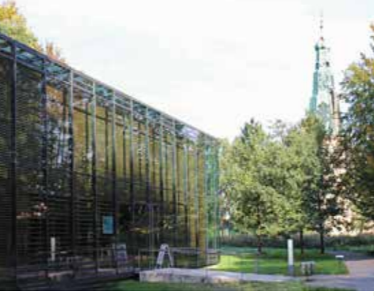
Du hättest gern mehr Infos? Im Naturparkhaus am Schloss Raesfeld laufen alle Fäden zusammen (RadRoute-Etappen 7, 8 und Q1).

Und schließlich die Parklandschaft des Münsterlandes, darin eingebettet Restflecken der alten Bruch- und Heidelandschaft. Und all diese Vielfalt in erstaunlicher Nähe zum menschlichen Siedlungsraum: Hier kannst du im Stadtgebiet losradeln – ununterbrochen durchs Grün bis ins Naturschutzgebiet!