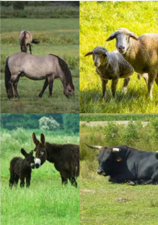
Lippe • Stever • Isselquelle • Halterner Stausee • Hullerner Stausee • Pröbstingsee • Bocholter Aa • Aasee

Was würden wir nur tun ohne sie? Der Schutz, ja sogar das Überleben bestimmter Landschaftstypen hängt davon ab, dass sie als Flächen offen gehalten werden – geschützt vor übermäßigem Bewuchs und Verbuschung. Und das wäre mit menschlicher Arbeit allein kaum zu schaffen. Deshalb wirst du am Rande deiner Route, im Grünland der Flussauen, Heiden und Feuchtwiesen, immer wieder unsere tierischen Helfer finden: Urtümliche Heckrinder, eine Rückzüchtung der Auerochsen. Oder zottelige Riesenesel aus dem Poitou. Wilde Konikpferde, immer wieder Schafherden. Nicht nur ein schöner Anblick, sondern eine unentbehrliche Hilfe bei der Landschaftspflege im Naturpark.