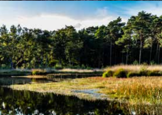
Heubachwiesen • Rhader Wiesen

Selten geworden, aber bei uns kannst du sie noch entdecken: Landschaften, wo die Natur so aussieht wie seit Jahrhunderten. Etwa die Westruper Heide – sie ist das größte zusammenhängende Heidegebiet in unserem Naturpark. Hier kannst du dich vom herben Charme dieser so urtümlich wirkenden Landschaft einfangen lassen. Oder die Fürstenkuhle: Der letzte Überrest einer einst mächtigen Moorlandschaft – und zugleich eines der seltenen Gebiete, in denen das Entwicklungspotential zurück zum Hochmoor noch vorhanden ist. Das bedarf eines besonders sorgsamsten Umgangs. Der Lohn: Eine ganz eigene Pflanzen- und Tierwelt, darunter die seltenen Moorfrösche, deren geheimnisvolles Hochzeitskonzert im Frühjahr die Besucher fasziniert.