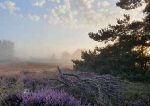
Westruper Heide • Fürstenkuhle/Kuhlenvenn