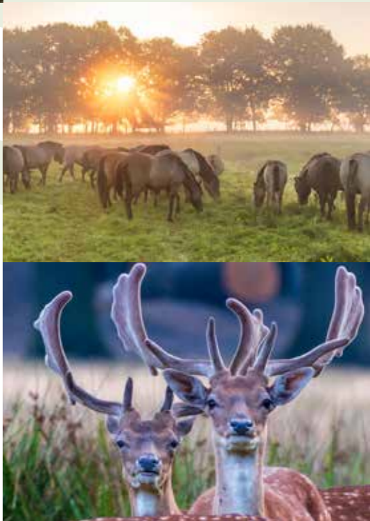
Merfelder Bruch • Wildpark Dülmen

Es muss ja nicht immer nur „ungezähmte“ Natur sein, oder? Auch mit menschlicher Planung können grüne Oasen entstehen, die das Auge erfreuen! Immer wieder auf deiner Route triffst du auf wunderschön angelegte Parks und Tiergärten, oft rund um malerische Burgen oder Schlösser gelegen. Oder auf liebevoll gepflegte Gärten mit seltenen Pflanzen, auch auf großzügige Gehege, in denen du einheimische Tierarten bewundern kannst – an der Wasserburg Anholt etwa, im Bocholter Stadtwald oder im Tiergarten bei Schloss Raesfeld.