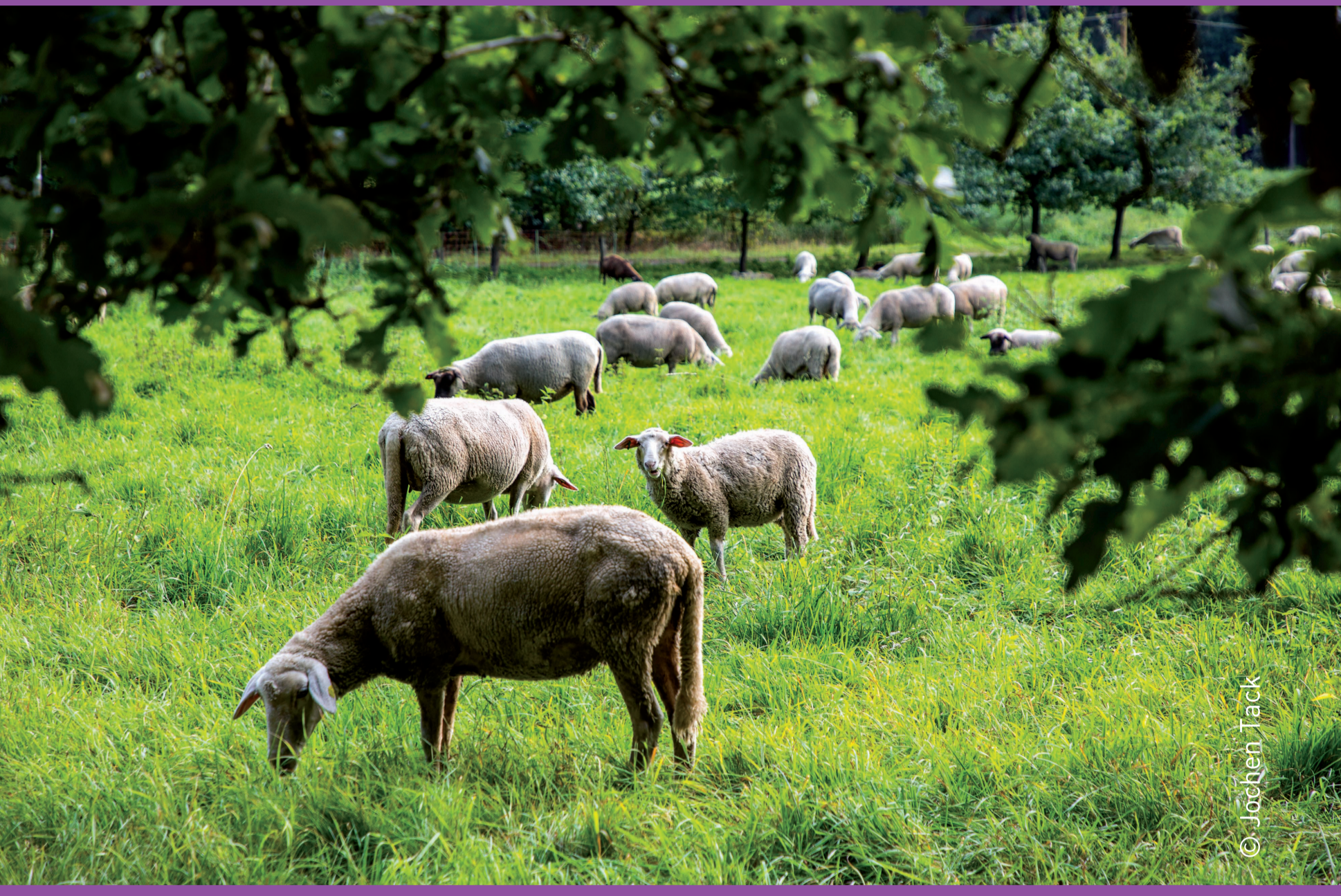
Schafe als Landschaftspfleger