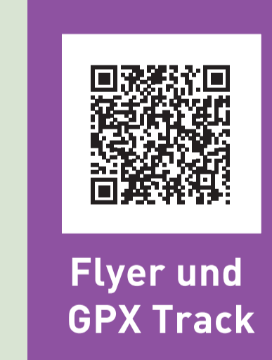
Flyer und GPX Track