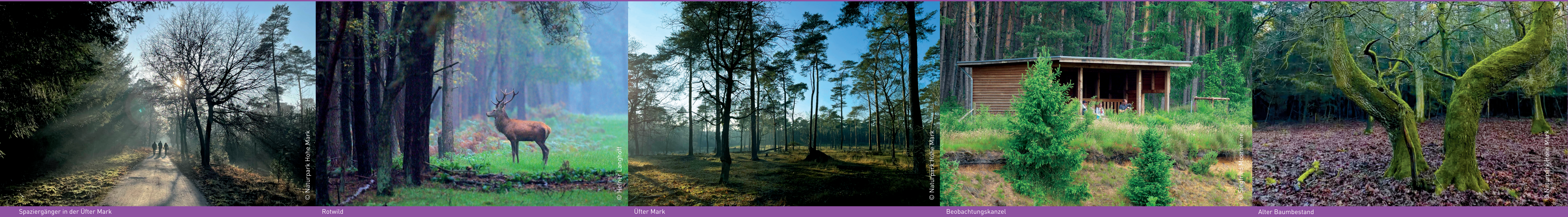
Spaziergänger in der Üfter Mark